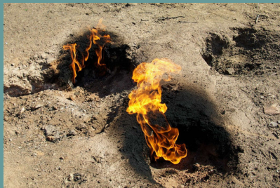
Fenomenele ciudate din judetul Buzau

Lasa-ne pe noi sa-ti cream traseul catre Paradisul romanesc!